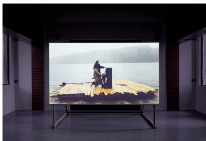
Julie Chaffot Hot Dog , 2013 Moyen-métrage, 47' Projet de résidence artistique au Château de Vassivière