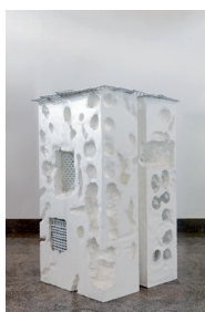
Anita Molinero Porcelaine blanche, Polystyrène blanc , 2003 Porcelaine et polystyrène Réalisé au Centre de recherche sur les arts du feu et de la terre CRAFT, Limoges