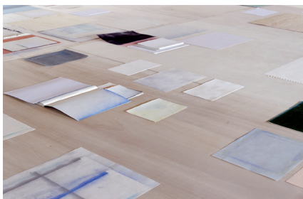
Mélanie Blaison Sans titre , 2013 papier, gouache, empreinte 27 x 27,2 cm