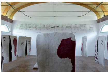
Pierre Redon Tülü , 2013 Tapis Filikli en poils de chèvre de Turquie, composition musicale (50' en boucle), dessin mural de la partition, capes en feutre cartographiées, coussins en feutre, mobilier en bois, matériaux divers Installation co-produite par Les Sœurs Grées, Centre international d'art et du paysage, Fondation La Borie en Limousin, K2 à Izmir (Turquie)