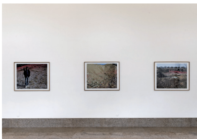
Anne-Lise Seusse Mont Verdun, Ball-Trap, Le terrain , 2010 Photographie argentique 80 x 100 cm

Visuels en 300 dpi disponibles sur demande à Georges Ottavy :