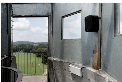
Dominique Petitgand Proche, très proche , 2006 / 2013 Installation sonore pour 5 haut-parleurs (extrait transcription)