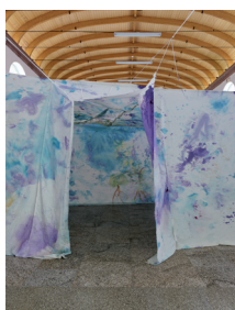
Reto Pulfer Das Türkise Zustandsgrab , 2010 Encre, aquarelle, crayon, stylo sur textile, 420 x 420 x 230 cm Vue de l'exposition « Regionale - The Village Cry », Kunsthalle de Bâle, 2010